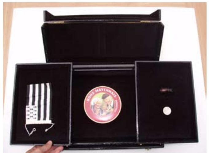
> Le cabinet de curiosités mobile après