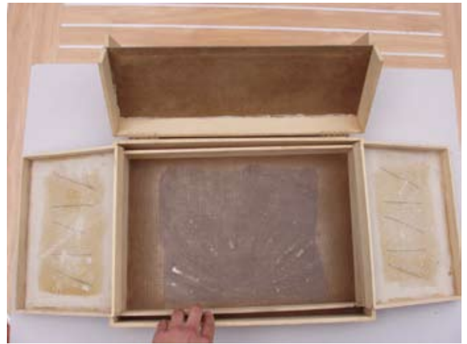
> Le cabinet de curiosités mobile en pleine transformation