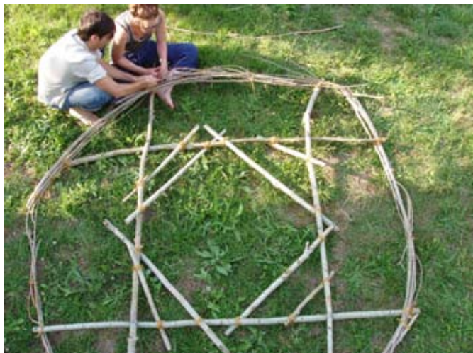
> Michaël & Caroline préparant la structure pour poser la hutte sur le fresne têtard