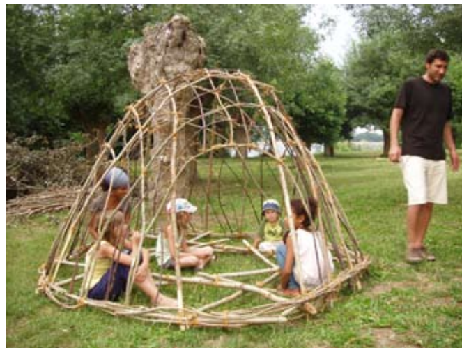
> Des enfants s'amusant dans la hutte