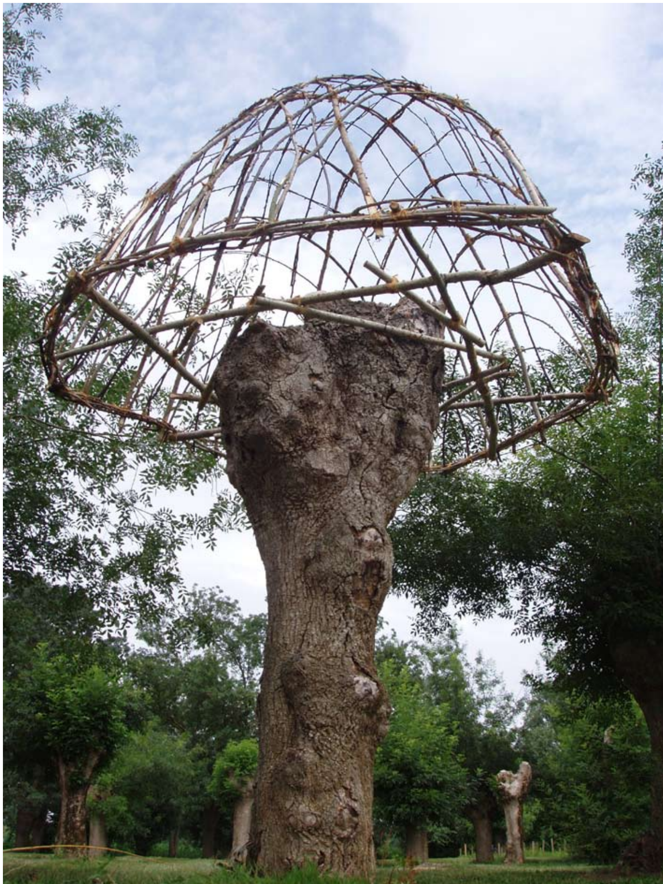
> Installation parasite & protubérante de la structure coupolaire pygmée élevée sur un frêne « têtard »