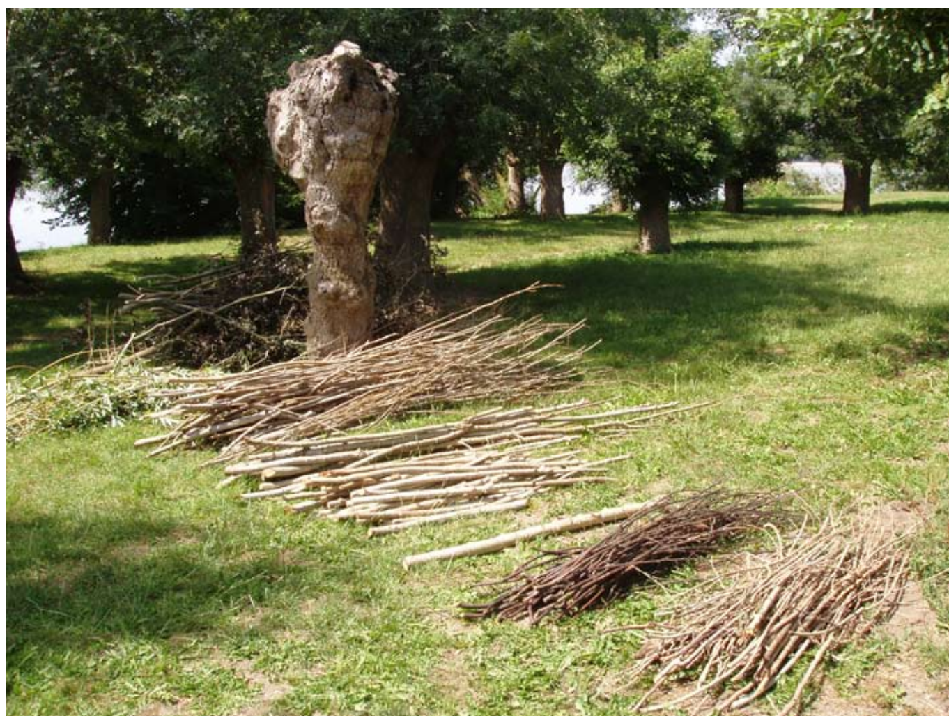
> La classification des matières premières

de chauffe, ce qui lui donne cette forme bien particulière).