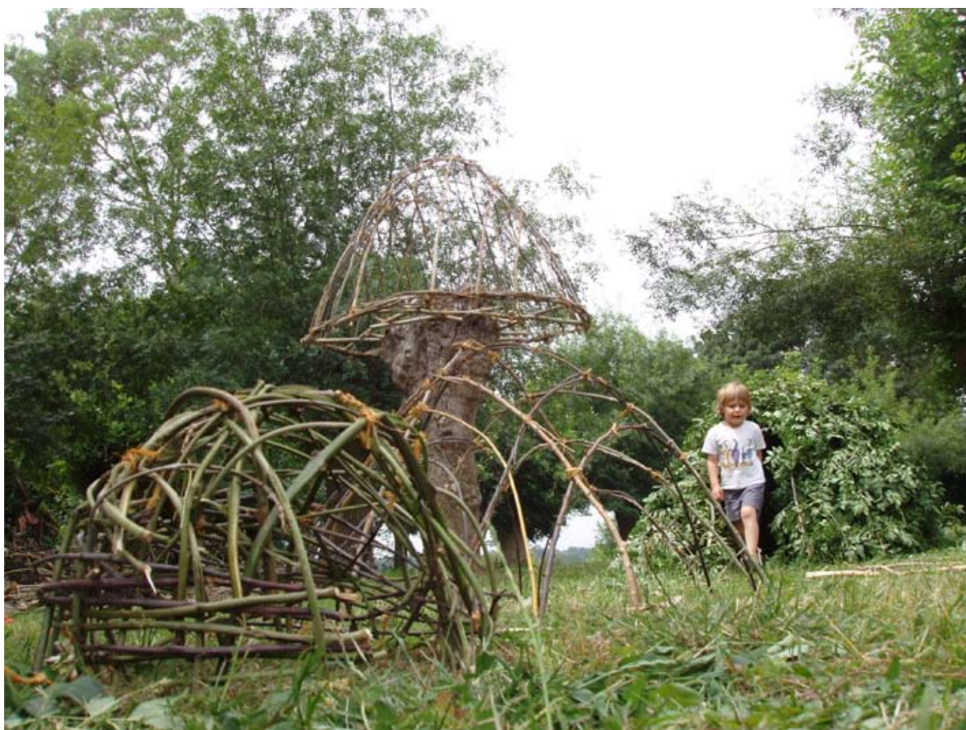
> Installation protubérante & parasite de plusieurs petites structures, toutes inspirées de la hutte coupolaire pygmée