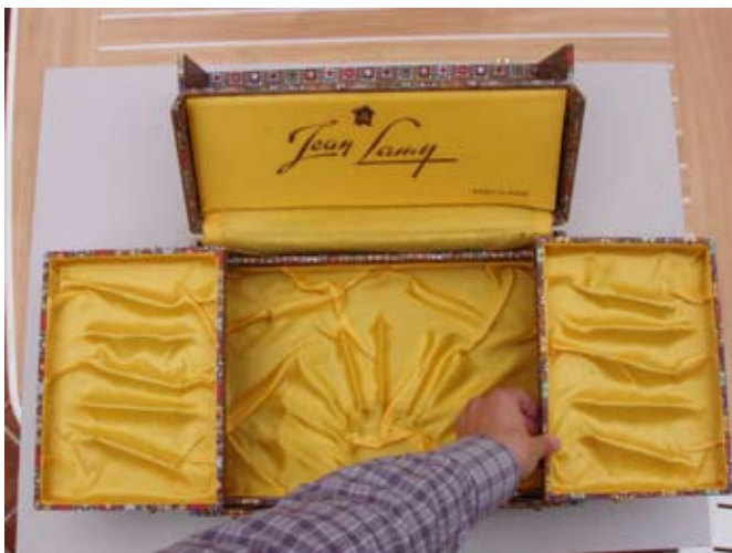
> Le cabinet de curiosités mobile avant