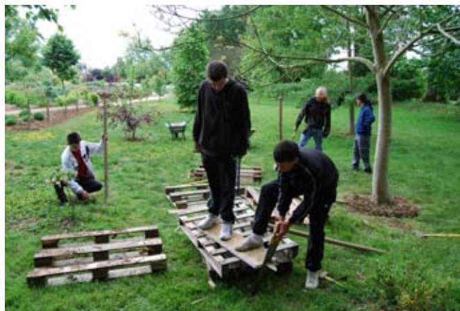
> De la préparation