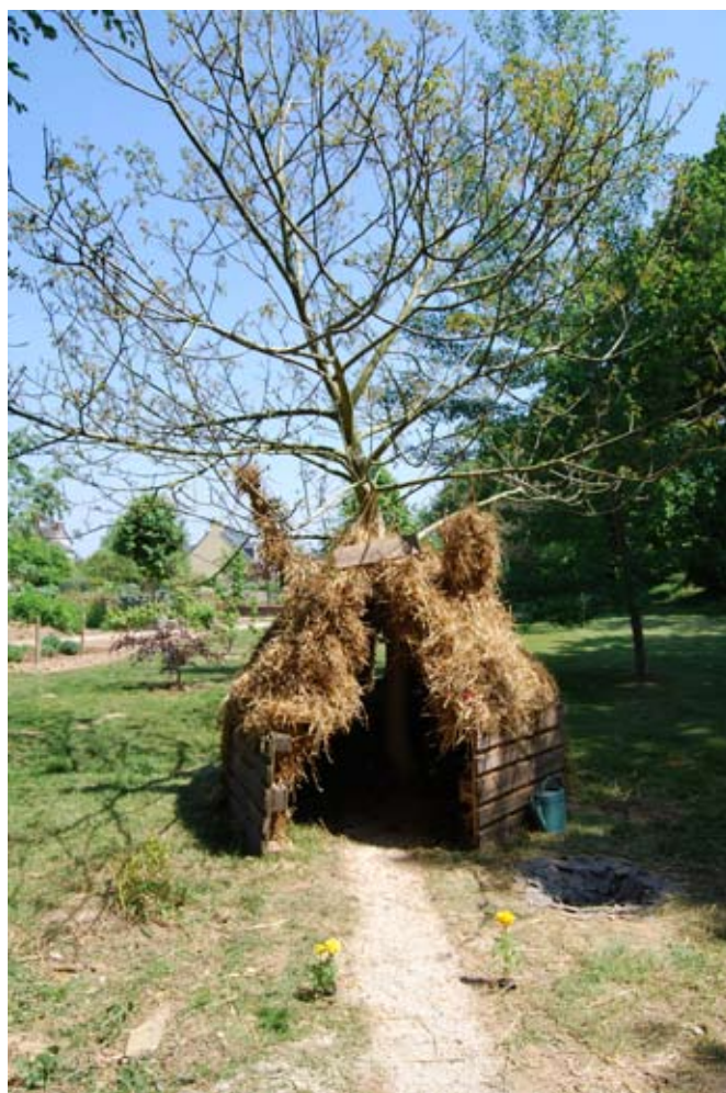
> « Courtepaille »