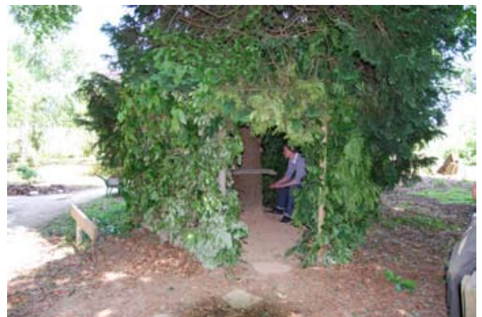
> De la méditation