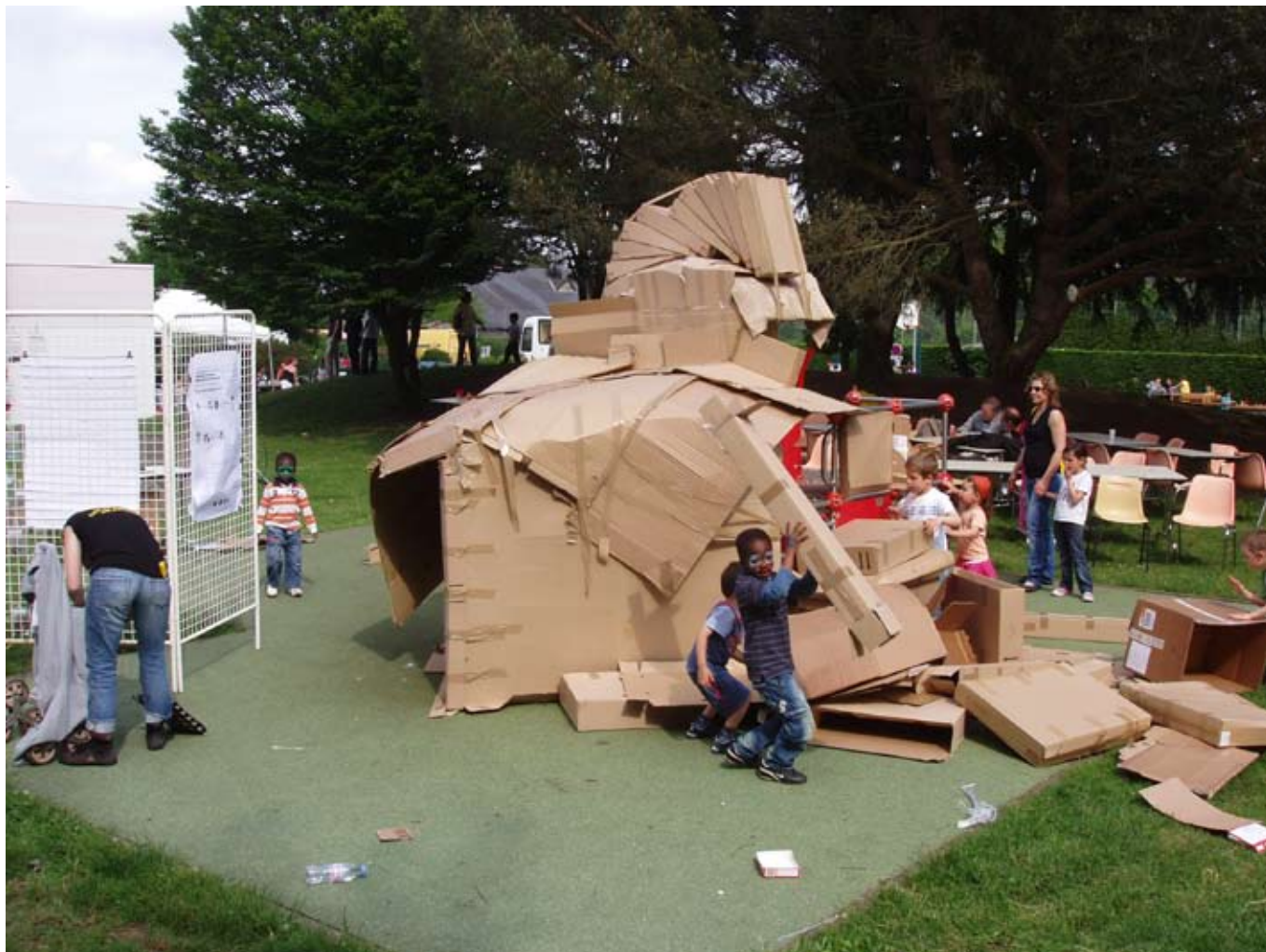
> L'acte de destruction