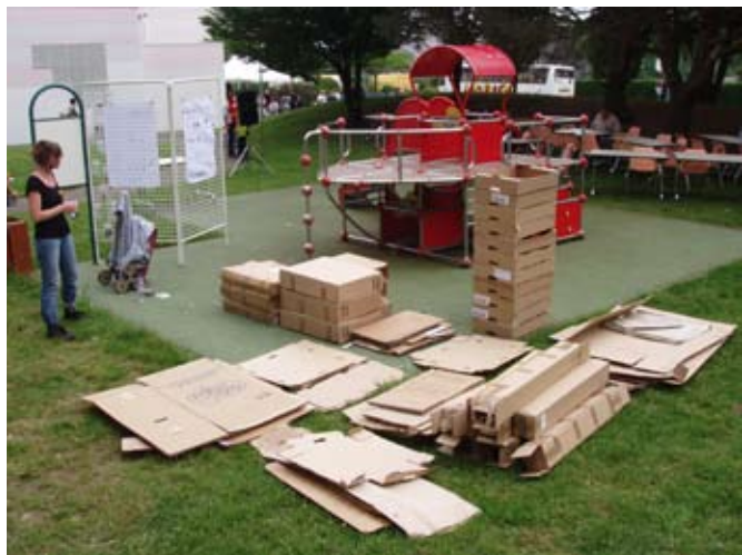
> La structure de jeux comme support