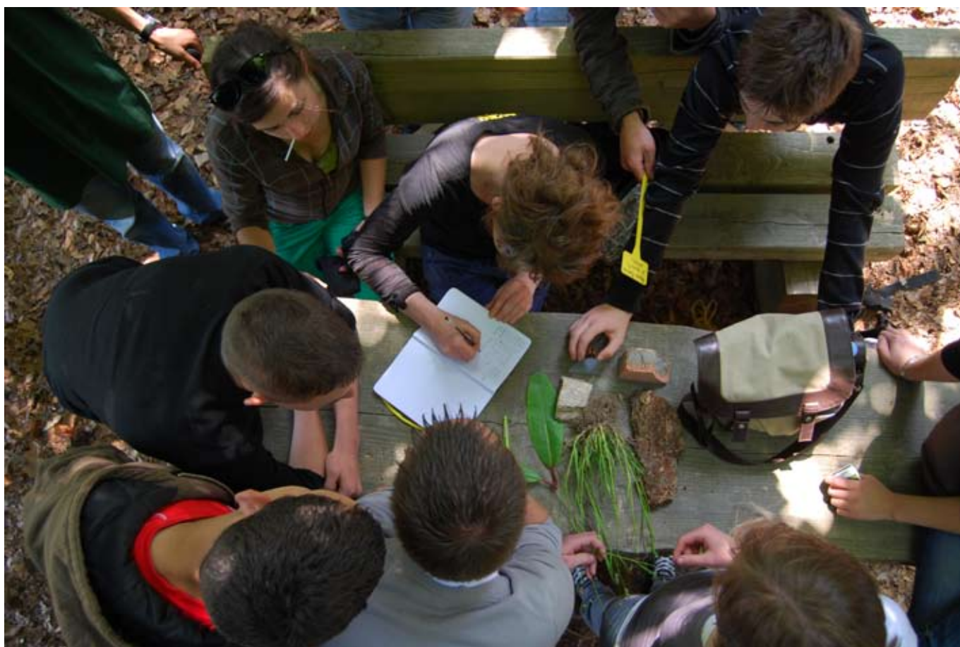
> La récolte des morceaux de paysage

Cabanes & paysages ambulants en Amériques a commencé son cycle de construction de cabanes et de récolte de morceaux de paysages. « Les déchiffreurs de paysages » sont intervenus auprès des élèves de 2 nd e horticole au Lycée du Mené à Merdrignac durant deux jours. Trois installations ont pris forme.