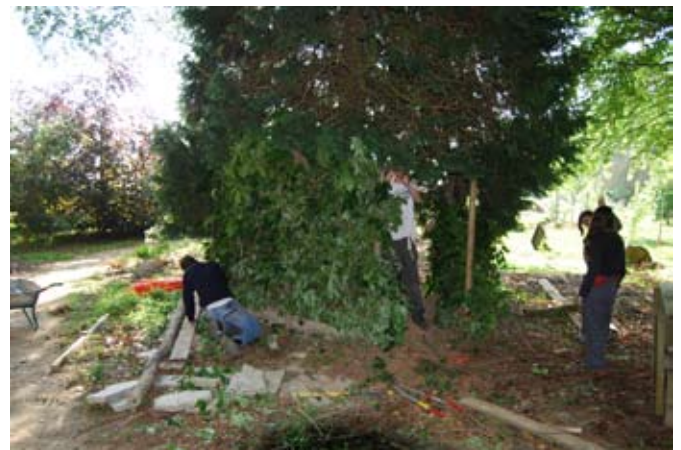
> De la construction