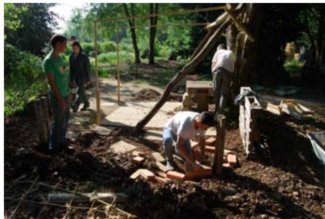
> De la construction