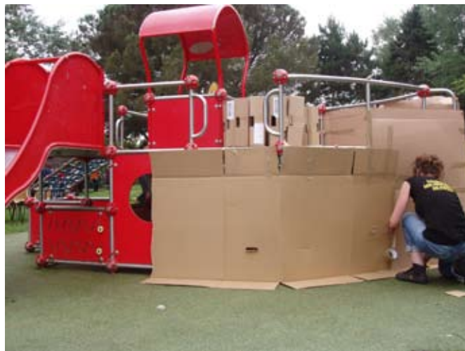
> Le début du parasitage