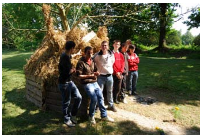
> « Courtepaille » & ses créateurs