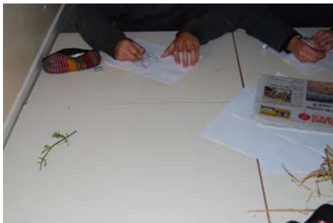
> De la réflexion