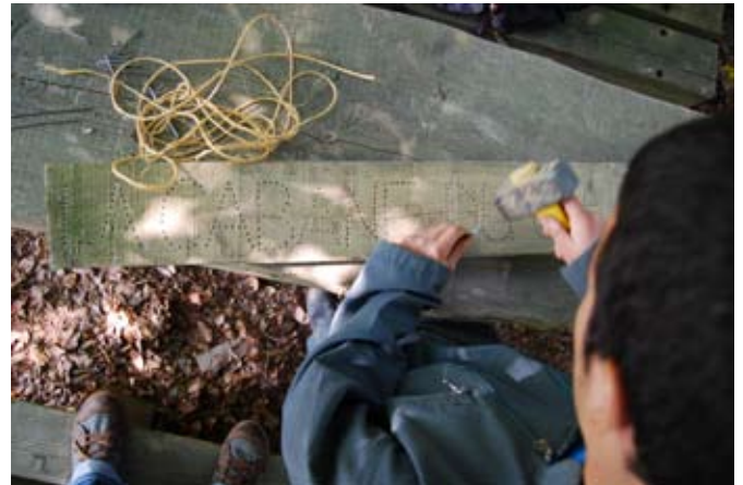
> De l'inscription