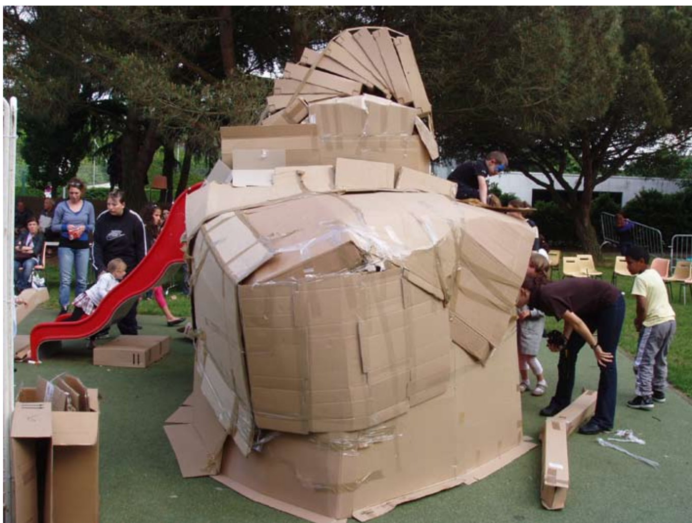
> Installation protubérante & parasite