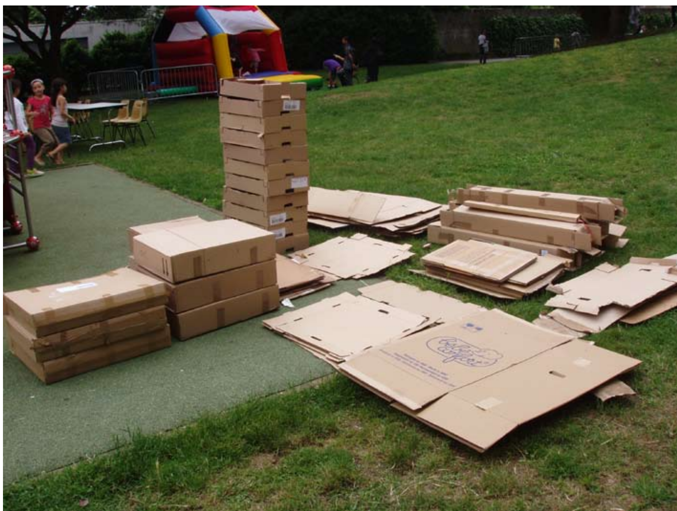
> La classification des matières premières

Le cycle de construction continue. « Les déchiffreurs de paysages » ont participé à la fête du quartier de Belle Beille en partenariat avec le centre social Jacques Tati. Cette installation protubérante est le résultat d'une performance lors de l'après-midi du 12 juin. Elle s'est finalisée par la destruction totale de l'installation par les enfants.