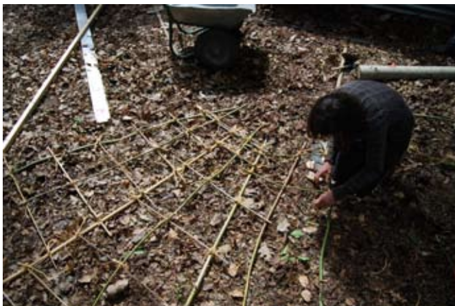
> De la préparation