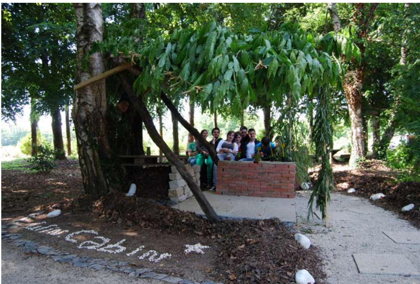
> La « Win cabin » et ses créateurs