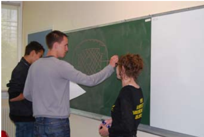
> De la réflexion