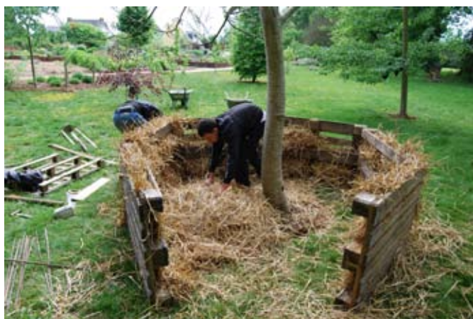
> De la construction