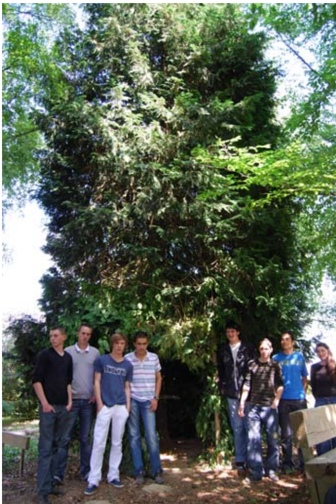
> « La cabane du sapinier » & ses créateurs